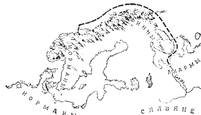
3. Плавание викинга Отара

«Отар сказал, что однажды захотелось ему проведать, как далеко на север простирается эта земля (Норвегия. — В.В.), иначе говоря — какие люди обитают за этой пустыней дальше на севере. Держась северного направления близ берега, в течение трех дней он имел пустынную страну всегда справа, а море — слева. Тогда он достиг такой северной широты, дальше которой китоловы обыкновенно не проникают. Однако он отправился еще далее на север, сколько мог проплыть в три дня; тут земля эта начала поворачивать на восток (около Нордкапа. — В.В.). Здесь он дождался ветра с западо-северо-запада, а потом поплыл вдоль берега (Мурманского. — В.В.) на восток, сколько мог проехать в четыре дня. Тут (у Св.Носа. — В.В.) он был