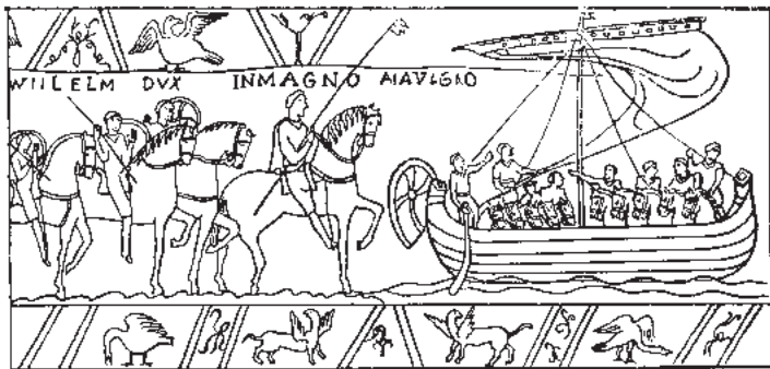
4. Отплытие викингов. (По рисунку на древнем гобелене в Байе. XI век).

тельную колонию, которая в темные времена средневековья стала оазисом культуры и дала школу историков, какой в эту эпоху не было ни в одной европейской стране. Нередко викинги пробирались и в Белое море, где конечной целью путешествия являлось устье Северной Двины. В X—XI веках викинги находили здесь богатейшие селения. Наперекор суровой северной природе жители Беломорья осваивали свой край, добывали зверя, строили не только поселения, но и богатые, красивые храмы.